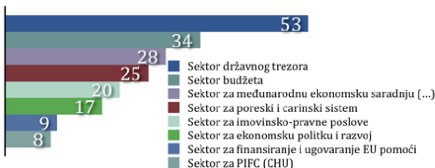
Sistematizovana radna mjesta u Ministarstvu finansija

o imenovanju i sistematizaciji CHU, radi upisa podataka u registar i planiranja obuka. Registar nije javan, odnosno, ne nalazi se na internet stranici CHU, ali se podaci mogu dobiti kroz zahtjev za slobodan pristup informacijama.