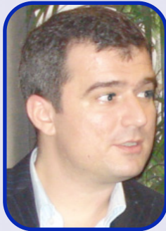
Piše: Stevo Muk

Sporazumom o Stabilizaciji i pridruživanju (SSP) i Evropskim partnerstvom, saradnja Vlade i nevladinih organi-